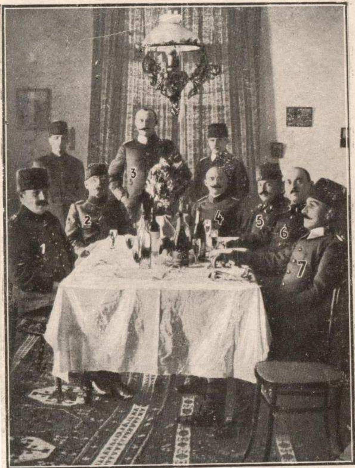
ATROCITÉS TURQUES EN ARMÉNIE Les Chefs des massacreurs Turcs et Allemands d'Erzeroum.