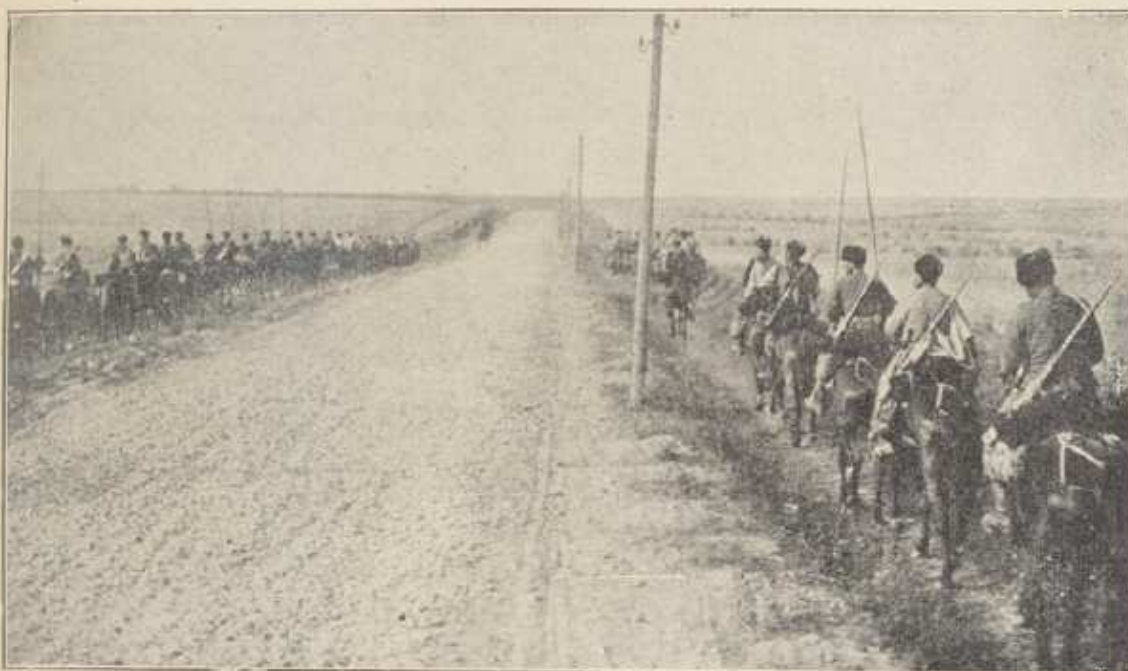
RECONNAISSANCE RUSSE AU CAUCASE.

La Turquie avait une tâche au-dessus de ses forces. Pour réprimer la grande révolte des Arabes qui s'étaient rendus maîtres de la Mecque, elle devait diriger contre eux neuf divisions. Elle devait en maintenir onze autres sur le front européen. Certes, elle possédait, en ses territoires d'Europe et d'Asie un vaste résér-