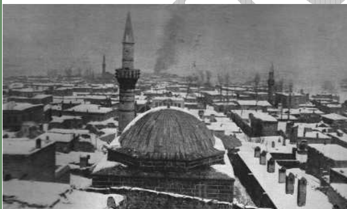
Vue générale d'Erzeroum, prise de la citadelle, le lendemain de l'occupation de la ville, quand brûlaient encore les incendies allumés par les turcs, sur divers points, avant l'évacuation.