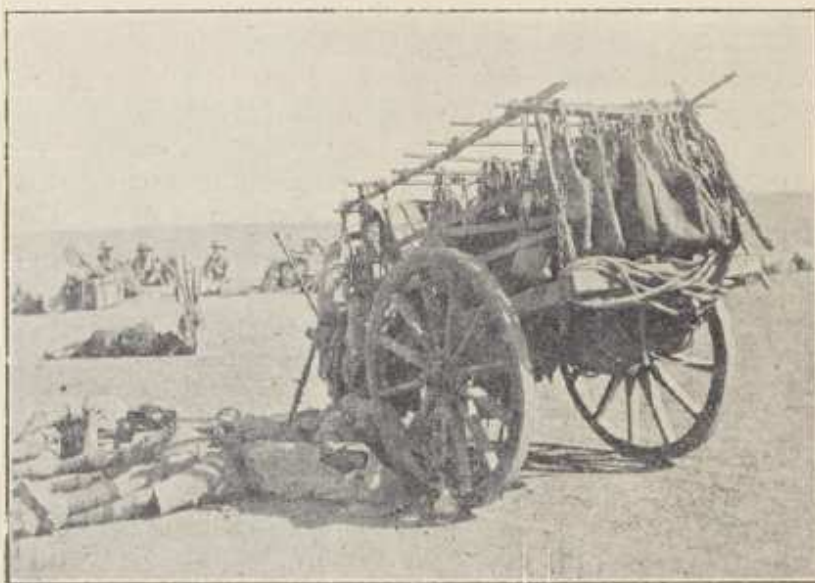
MÉSOPOTAMIE. — RAVITAILLEMENT EN EAU.

Après la chute de la grande forteresse, ce fut la chute du grand port de la mer Noire. Les troupes russes, appuyées par leur escadre de la mer Noire, entrèrent à Trébizonde, le 17 avril. Dès lors, rien n'empêchait plus la Russie d'envoyer des vivres, des munitions, des ren-