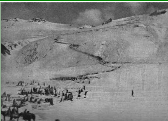
Les chasseurs du Caucase descendent du plateau de Kargabazar pour atteindre Erzeroum; trois petits groupes, se détachant en noir à mi-hauteur, au centre, font glisser des canons le long de la pente.