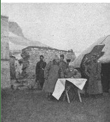
Le général Kalitine, commandant d'un des corps d'armée, suit sur la carte le rapport d'un officier d'état-major