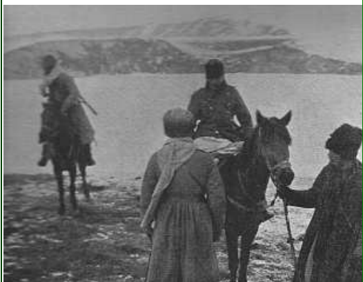
L'interrogatoire d'un officier turc qui, ayant les pieds gelés, a été hissé sur un cheval