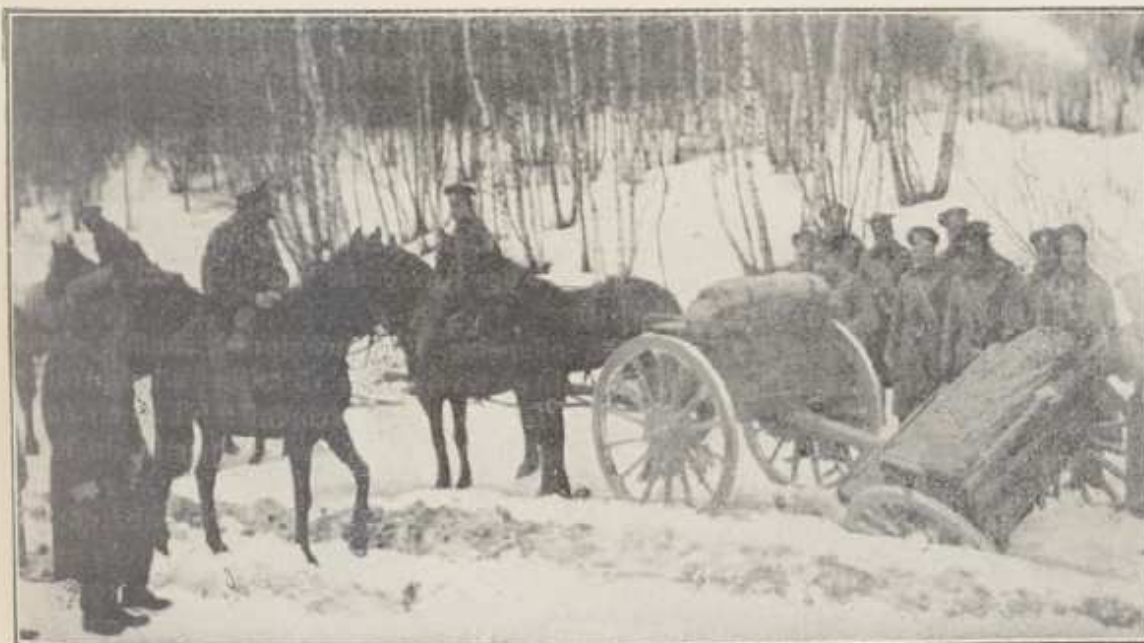
ARTILLERIE RUSSE ALLANT PRENDRE POSITION.

Dans le Caucase, les troupes russes commandées par le grand-duc Nicolas revinrent au combat contre les Turcs. Ni les difficultés formidables du terrain, ni les neiges amoncelées, ni le froid qui faisait descendre le thermomètre à 26 degrés