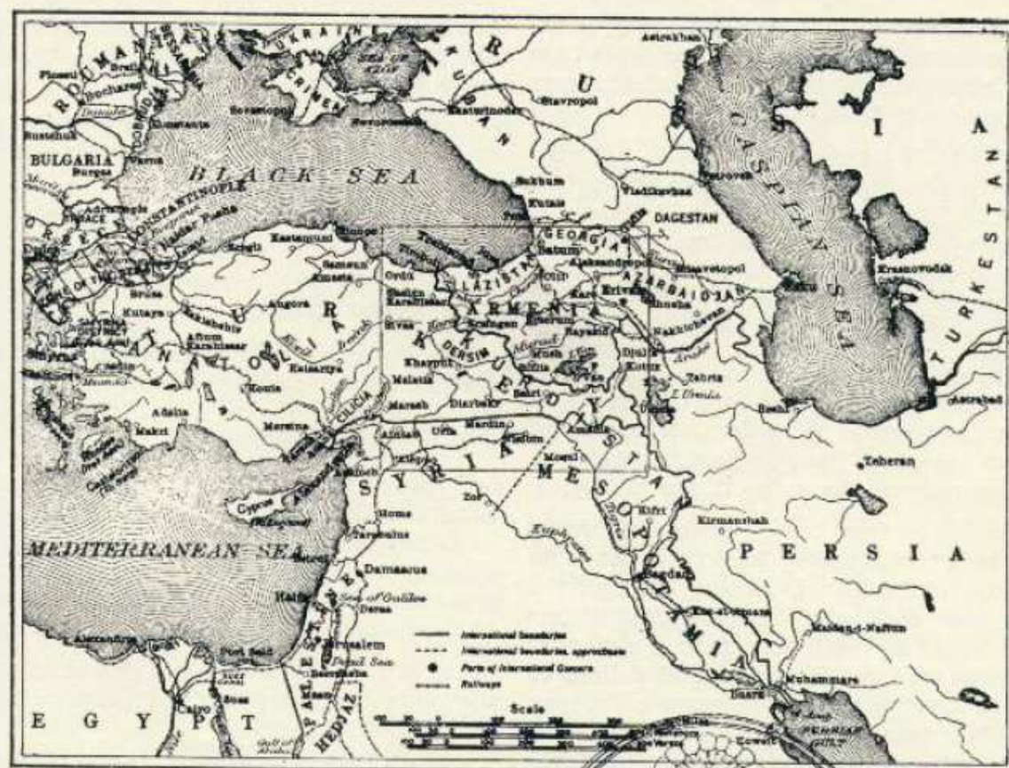
Map showing the boundaries of Armenia as awarded by PRESIDENT WILSON.