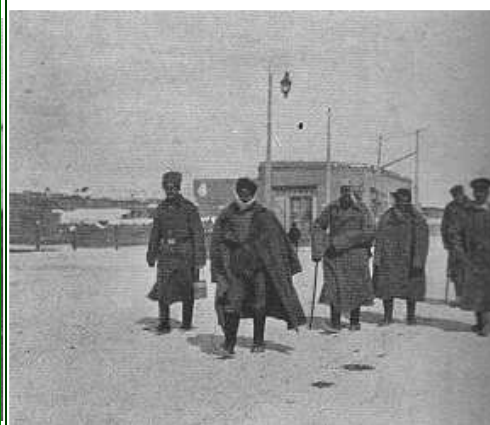
Prisonniers turcs, sur la route d'Ach-Kalé