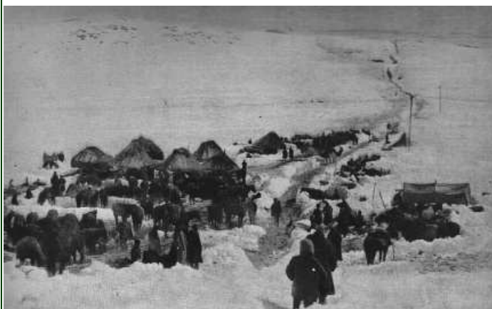
L'état-major de la 4eme division des chasseurs du Caucase campé au sommet du plateau de Kargabazar; à droite, le long de la piste, deux mâts portent des antennes de télégraphie sans fil.