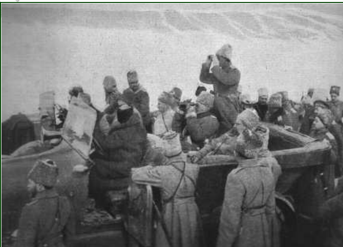
A trente kilomètres de la ville et à deux kilomètres de la ligne de feu, le Grand-Duc suit les mouvements de son armée, lancée à la poursuite de l'armée turque en retraite.