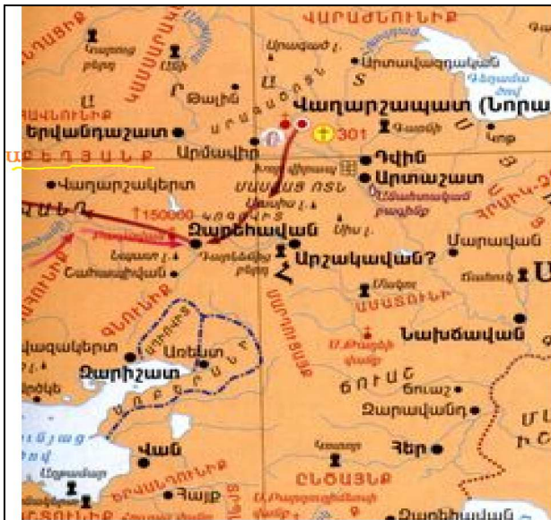
Աբեղեանք գաւառը՝ Աբեղի ստրուկոսներուն նստատեղին Պատկեր «23»