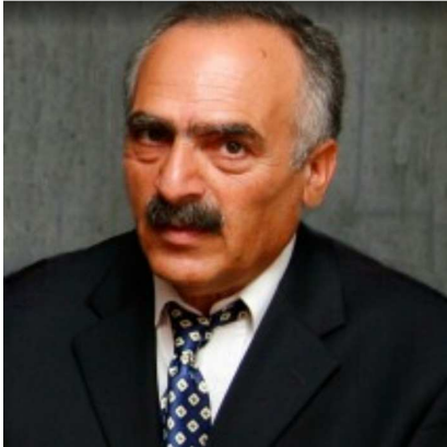
ՄՈՎՍԵՍ ՆԱՃԱՐԵԱՆ Արեւմտեան Հայաստանի Կրթութեան եւ Գիտութեան Նախարար

Մարդն արարել է ետք՝ երկրի վրայ առաջին արարիչ Յրեշտակապետ Յովիւ Դումուզի-Էա-Առիւծ Միեր-Արամազն իր ենթականերուն ժողովի հրաւիրեր է, անոնց ներկայացնելու համար արարուած երկրածին մարդը: