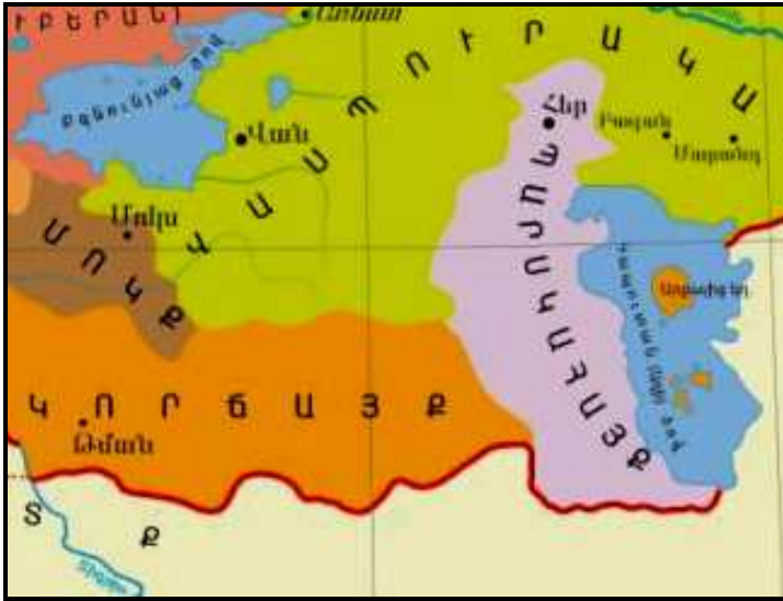
Գիւղ Ութօցը կամ Թմանը Պատկեր «22»

լեռնաշղթան, նաեւ ձեւաւորուել է Արարատեան դաշտը, որոս ամբողջ յատակին ովկիանոսէն մնացած աղերն են: