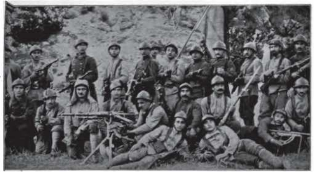
WITH THE BRITISH IN PALESTINE

Արեւմտեան Հայաստանի պետական հեռուստաընկերութիւնը Ձեգի կը ներկայացնէ Հայկական լեգիոնի մասին նիւթերու շարք, որ Նուկրուած է լեգիոնի ստեղծման 100 ամեակին: