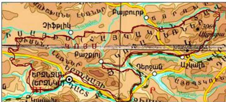
Անահտական Աթոռ լեռներ Պատկեր «20»

Մարդկանց որդիներու դաստիարակութիւնը վստահուեր է Սասնայ Ծուռ Դաւութի կին Անահիտ դիւցուհուն, այդ պատճառով ալ ան կոչուեր է Մայր Անահիտ, որն համաստեղութիւններու շարքին կը ներկայանայ որպէս Կոյս կենդանակերպ: Անոր աշխարհագրական նստավայրը կոչուեր է Անահտական Աթոռ, եւ երկրի վրայ կը ներկայացնէ Կոյս կենդանակերպի տարածքը (Տես՝ Պատկեր «20»):