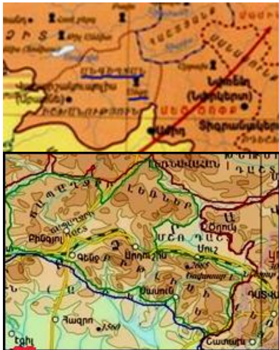
Սևգեղ Տուն Պատկեր "6"

Անոնց խորհրդանիշը եղած է Անգղ համաստեղության մանրապատկերը (Տես՝ Պատկեր "7"), ինչպիսին տեսանելի է Եգիպտական փառաւօններու ծեռքին: