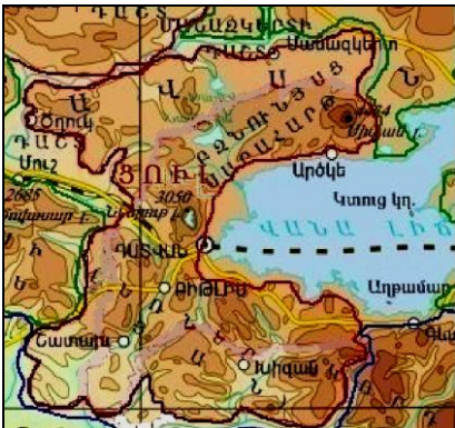
Ցուլ կենդանակերպի երկրային առաջին պատճէն Տաւրոյ Բերանը Պատկեր "1"

Արաբական առասպելն ընդարձակելով եղելութիւնը՝ կ'ըսէ, որ երկիր մոլորակը ծածկող ջուրերէն առաջին դուրս ելած հրէշ՝ ցամաքակղզին պատկերած է երկինքի Ցուլ կենդանակերպի պատճէնը: Սակայն Ցուլ կենդանակերպի երկնային պատկերը կ'ընդգրկէ Ցուլի միայն գլխամասը, որն աշխարհագրականօրէն կոչուած է Տաւրոյ Բերան 1 , այսինքն ցուլի բերանը, որ պատմութենէն մեզ յայտնի է նաեւ որպէս "Տուրուբերան" (Տարօն-Տուրուբերան):