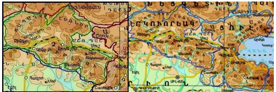
Սասնայ լեռներ Պատկեր "3"

Քանի որ երկրի վրայ կազմաւորուող ցամաքի երկրորդ հատուածն է, եւ ոչ միայն: Տեւ՝ Պատկեր "3"-ը: