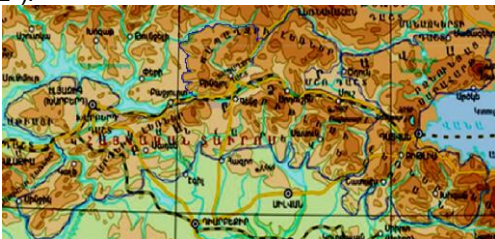
Հայկական Տաւրոս լեռնաշղթան Պատկեր "2"

Ամբողջական Ցուլը պատկերող լեռնաշղթան կոչուած է Հայկական Տաւրոս (Տեւ՝ պատկեր "2"):