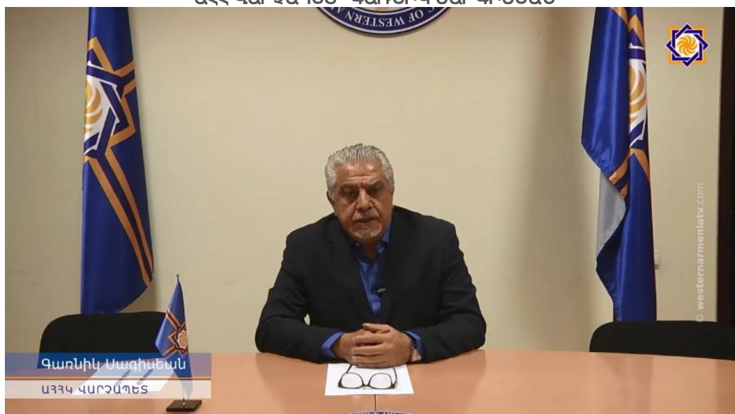
Գարնիկ Սարգիսեան ԱՀՀ ՎԱՐՉԱՊԵՏ

Ամփողջական տեսանիւթին կարելի է շանօթանալ հետեւեալ կապով. http://westernarmeniatv.com/34106.html