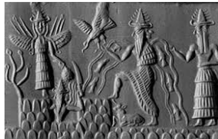
Էնկի-Հայա-ն՝ Կեդրոնին Պատկեր "5"

Էնկի-ն յայտնի է նաեւ ՀԱՅԱ մակդիրով: Տեւ՝ պատկեր "5"-ի կեդրոնական անձը: