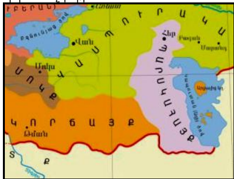
Պատկեր "2" Թման

զի տապանի հարեւանութեամբ երեւելի դարձած է բաւական ընդարձակ կղզի մը: Նոյի հետեւորդներէն 8 հոգի իջեր են տապանէն ու հաստատուեր են այդ լեռնկղզիի (Հայոց Միջագետքի Արարադ լեռան) հարաւային փեշերուն, ու բնակատեղին կոչեր են թման: Տես Պատկեր "2"-ն: Սակայն աւանդութեան մէջ կայ բնաւարկելի երկու անձնութիւն: