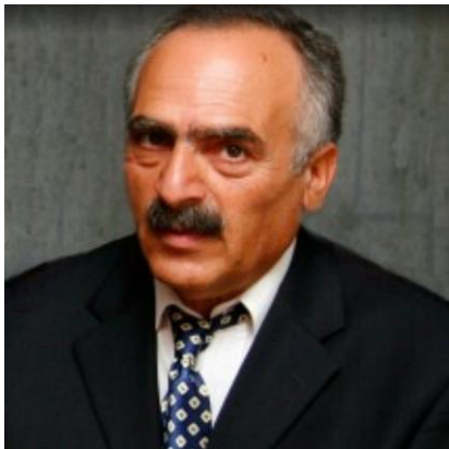
ՄՈՎՍԵՍ ՆԱՃԱՐԵԱՆ Արեւմտեան Հայաստանի Կրթութեան եւ Գիտութեան Նախարար

(Կարդացուած «Ազնի Յոգայ»-ի հետեւորդներուն առջեւ, Երեւանի Տիկնիկային թատրոնի դահլիճէն ներս, 2004 թուականին)