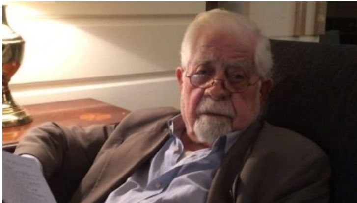
ՍԵՐ Գ. ՏԵՐՏԵՐԵԱՆ

Կ'ապրինք անցումային ժամանակներու մէջ. պատերազմի եւ տնտեսական ճգնաժամի հին միաբեւեռ աշխարհակարգէն դէպի խաղաղութեան ու բարգաւաճումի նոր բազմաբեւեռ աշխարհակարգ , որուն լուսամիտ առաջնորդներն են Ֆրանչիսկոս Ա., Կլատիմիր Փութին եւ... Սերգէյ Լաւրով: