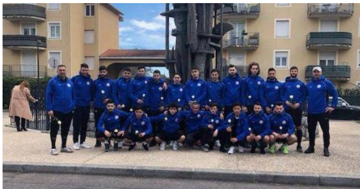
Արեւմտեան Հայաստանի ֆուտբոլի ազգային հաւաքականը

Լոնդոնի մէջ շարունակուող CONIFA-ի աշխարհի առաջնութեան ընթացքին՝ Արեւմտեան Հայաստանի հաւաքականն արդէն անցուցած է երեք խաղ: Փանջաբի դէմ խաղին՝ Արեւմտեան Հայաստանի հաւաքականը 1:0 յաղթեց, իսկ Կաբիլիայի դէմ խաղին՝ գրանցեց բարձրաթիչ յաղթանակ՝ 4:0 հաշուով, առաջ անցնելով հակառակորդ թիմէն: