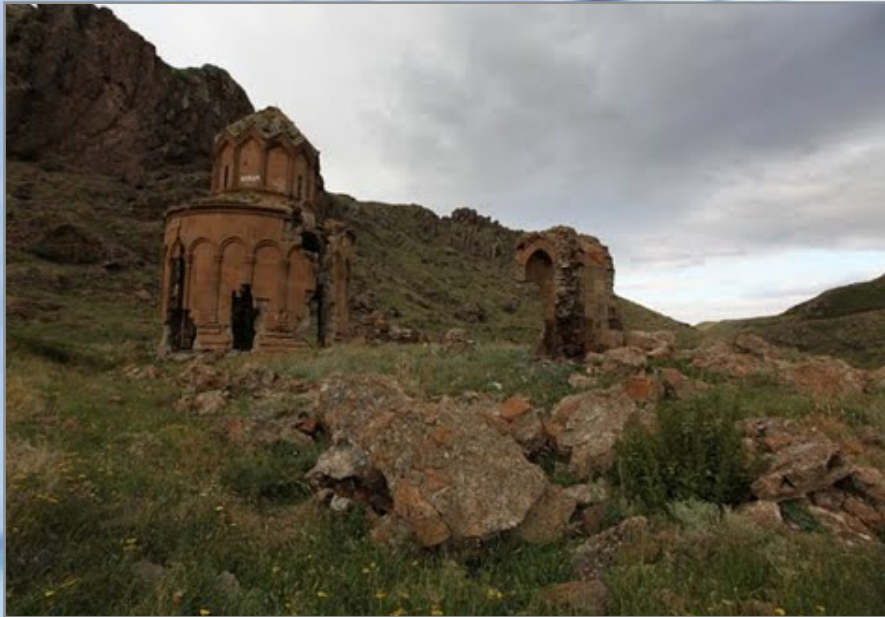
Տեկոր գյուղ. Խժկոնքի վանք 21-րդ դար

http://www.western-armenia.eu/stat.gov.wa/index.htm