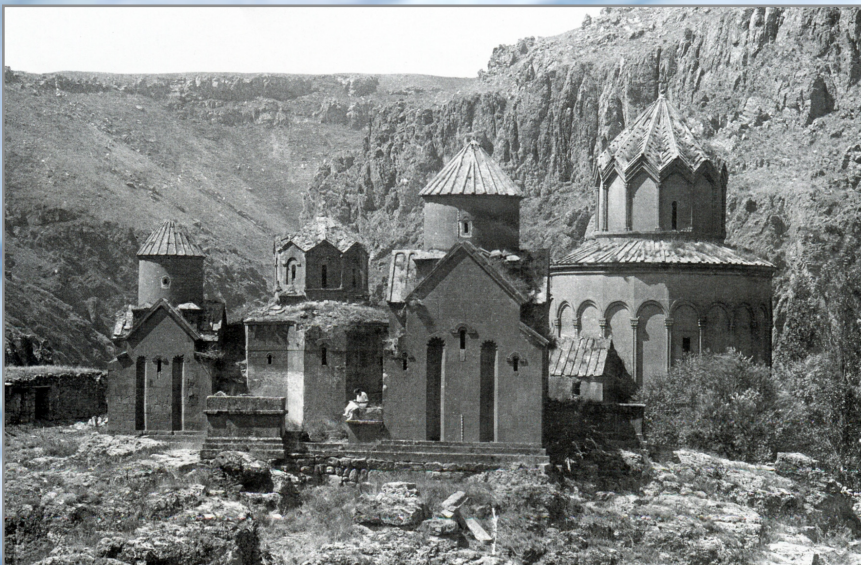
Տեկոր գյուղ. Խժկոնքի վանք 20-րդ դար