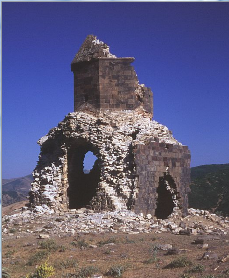
Մշո Սուրբ Կարապետ 21-րդ դար

http://www.western-armenia.eu/stat.gov.wa/index.htm