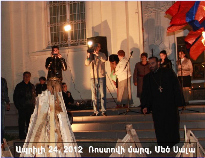
Ապրիլի 24, 2012 Ռոստովի մարզ, Մեծ Սալա