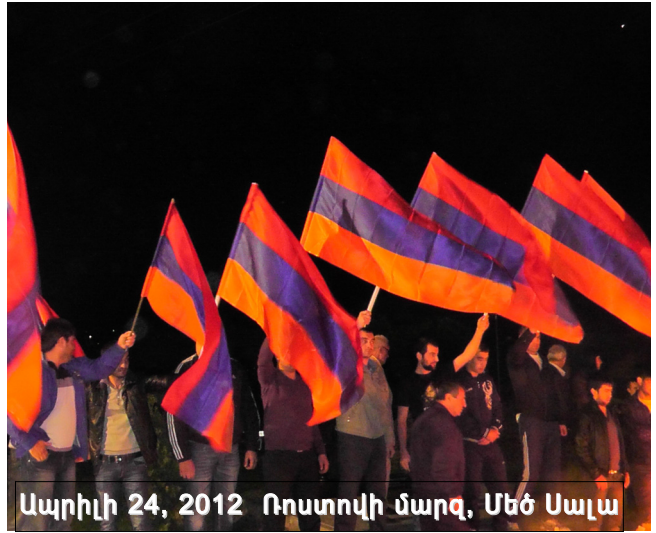
Ապրիլի 24, 2012 Ռոստովի մարզ, Մեծ Սալա