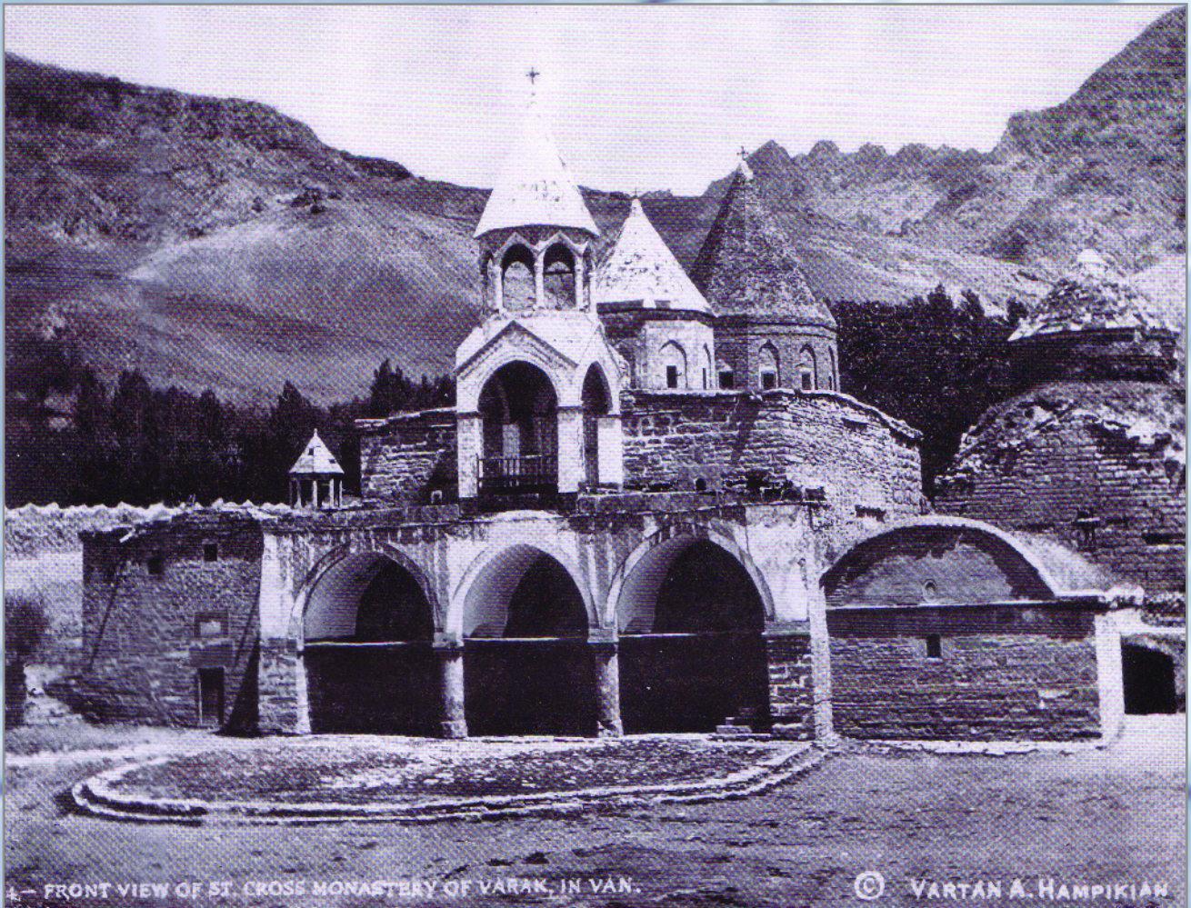
4.— FRONT VIEW OF ST. CROSS MONASTERY OF VARAK, IN VAN.