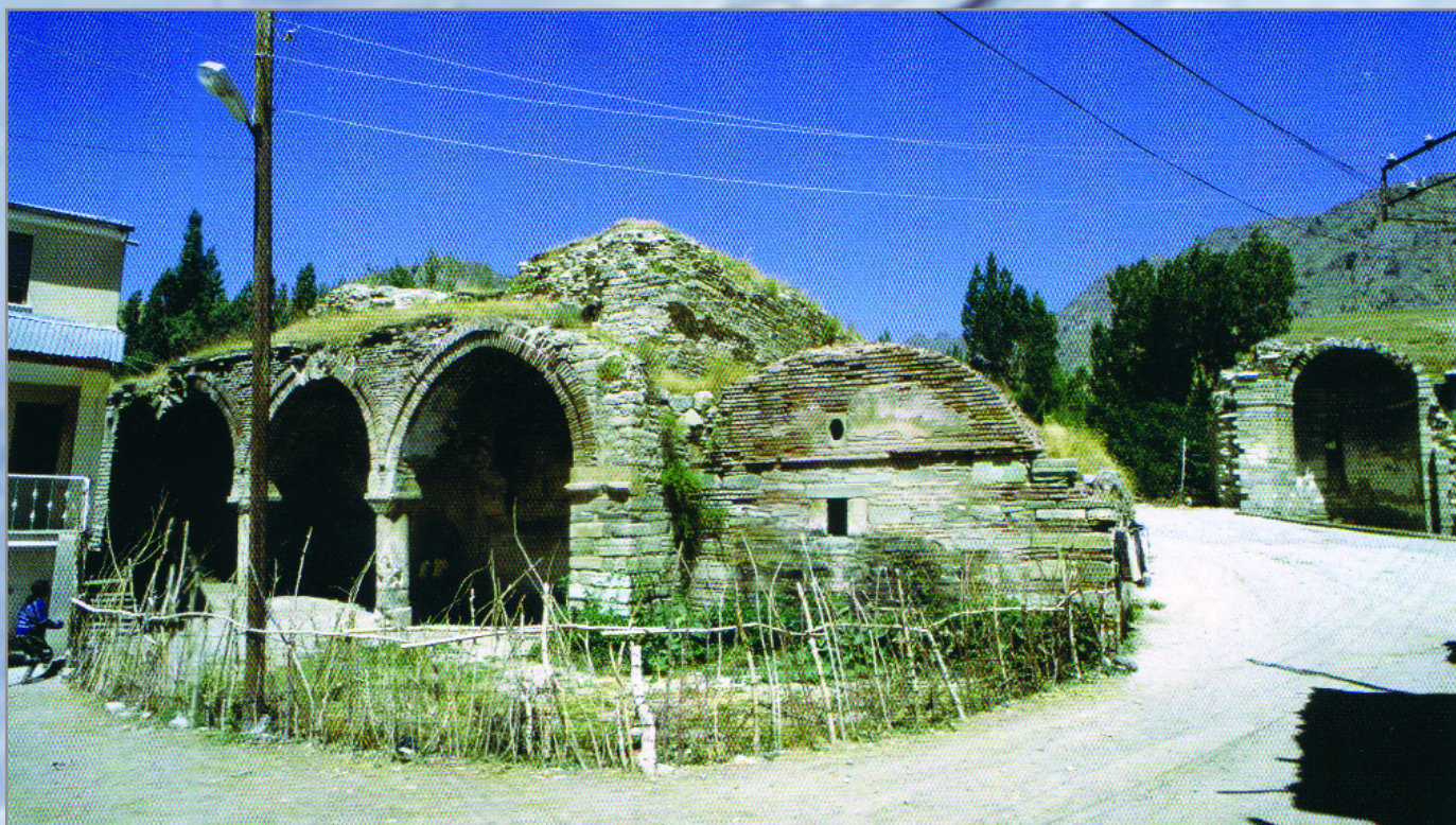
ՎԱՐԱԳԱՎԱՆՔ. վանքի մնացորդները հարավ-արևմուտքից (լուս.՝ Սամվել Կարապետյանի, 2007թ.)