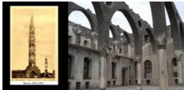
Արեւմտեան Հայաստանի հայկական գերեզմաններու վիճակը

Տիգրանակերտի Նահանգ - Տիարպեքիր, - Հայկական ներկայութեան յիշատակը յարուցանելով՝ ինչ որ է Արեւմտեան Հայաստանի մէջ, Տիարպեքիրի աշխատողները 3,5 միլիոն տոլարի վերանորոգման ծրագրի վերջին մանրամասնութիւնները կ'ամբողջացնեն, ինչ որ օր մը Մերձատր Արեւելքի ամենամեծ եկեղեցիներէն մէկը եղած է՝ Սուրբ Կիրակոս եկեղեցին: