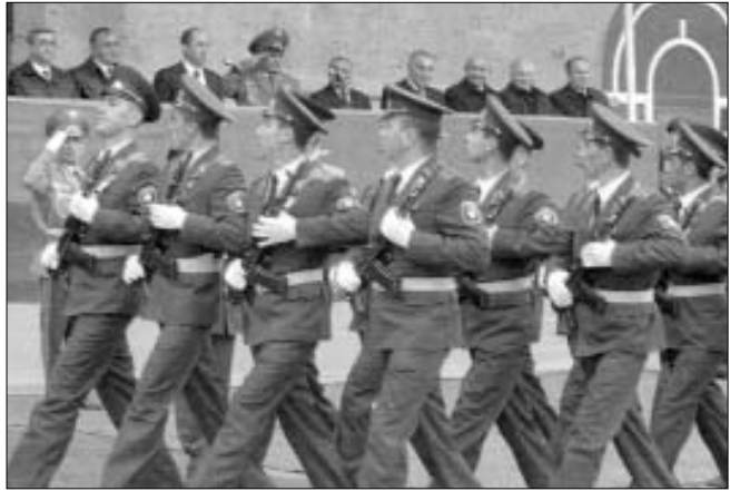
է ավելի ու ավելի կատարելագործվի:

Յ. Գ. - Յուրաքանչյուր պետության, ժողովրդի ամրության ու ապահովության գրավականը բանակն է, որը երբեք չպետք է անուշադրության մատնվի: Այն միշտ պետք