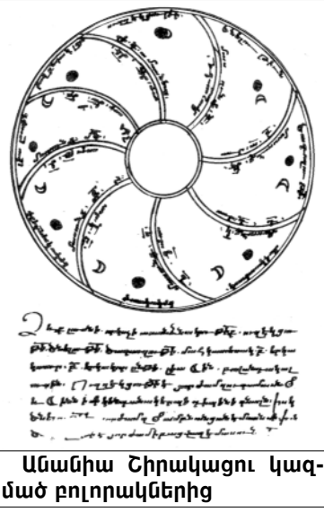
Անանիա Շիրակացու կազմած բոլորակներից

Կարևորելով կրթությունը և դաստիարակությունը՝ չպետք է անտեսել նաև բնատուր ունակությունը: Բնատուր կարողությունները սոսկ նախադրյալներ են, որոնք բացահայտման, զարգացման կարիք ունեն: Դասավանդման ընթացքում Շիրակացին կարևորում է նյութի մատուցման ձևի, դասագրքերի կառուցվածքի մեթոդական ցուցումների պարզությունն ու հստակությունը, որոնք ապահովում են նյութի առավել խորը և դյուրին յուրացումը (մատչելիության մեթոդ):