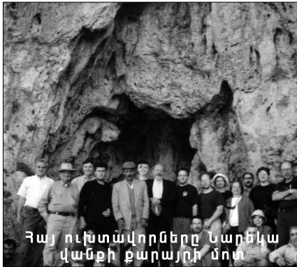
Հայ ուխտավորները Նարեկ վանքի քարայրի մոտ

Ա. Նարեկացու խրատներում քննվում են վանական կենցաղավարությանն ու բարոյագիտությանն առնչվող հարցեր։ Սակայն 10-րդ դարի հայ իրականության, վանական միջավայրի և մշակույթի պատկերը երևան հանելուց զատ հեղինակը անդրադառնում է մարդու ներքին հոգևոր կյանքին։ Նա իր ինքնատիպ խորհրդապաշտական աշխարհընկալմամբ քննության է առնում մարդ-արարածի մաքրագործման, կատարելագործման և Աստվածության հետ հաղորդակցվելու գաղափարները։ Մարդու մաքրագործումն ուղեկցվում է ներքին աղոթքով, որը ներանձնային ապրում է։ Ա. Նարեկացին մեզ է ներկայացնում հոգևոր կյանքի կարևորագույն մի պահի՝ աղոթքի քննությունը, որը կարևոր է յուրաքանչյուր հավատացյալի համար, քանի որ աղոթքի ոչ այլ ինչ է, քան մտքի գրույց Աստծո հետ։ «Ձկարգեալ աղօթէն հասարակաց գտուընջեան եւ զգիշերոյ բնաւ մի անտես առնէր։ Ջքո սահմանեալ առանձնական կարգն անխափան կատարեայ զաղօթից եւ զպահոց»։ Նարեկացին կոչ է անում աղոթքը հյուսել զղջումով, ջերմեռանդ արտասուքով, քանի որ արտասուքը հաշտեցնում է մարդուն Աստծո հետ։ Աստվածացումը և նրան հասնելու միակ ուղին հոգևոր սխրամքների ճանապարհն է՝ ուղեկցված աշխարհուրացումով, ճգնակեցական ինքնախարագանումով, հոգու նյութագերծումով, հոգևոր ինքնակատարելագործմամբ։ Նարեկացու համար փրկությունը անհատական սխրամք է։ Սակայն այս ամենի հիմքում ընկած է մարդու ինքնազննությունը, մարդու ընտրության արվեստը, որը ներկայանում է որպես բազում ջանքերի, ինքնակատարելագործման ու ինքնահաղթահարման