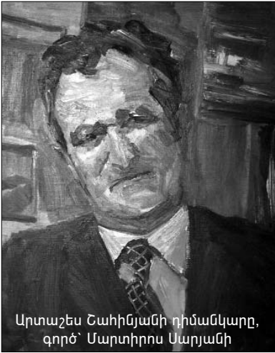
Արտաշես Շահինյանի դիմանկարը, գործ՝ Մարտիրոս Սարյանի