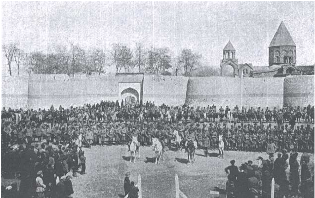
Le 3e bataillon de cavalerie arménien et les troupes commandées par Hamazasp Srvandztian se rassemblent à Etchmiadzin en 1914.

http://www.western-armenia.eu/archives-nationales/Zoravar_Antranig/Le_General_Antranik_parle-24.09.2018.pdf