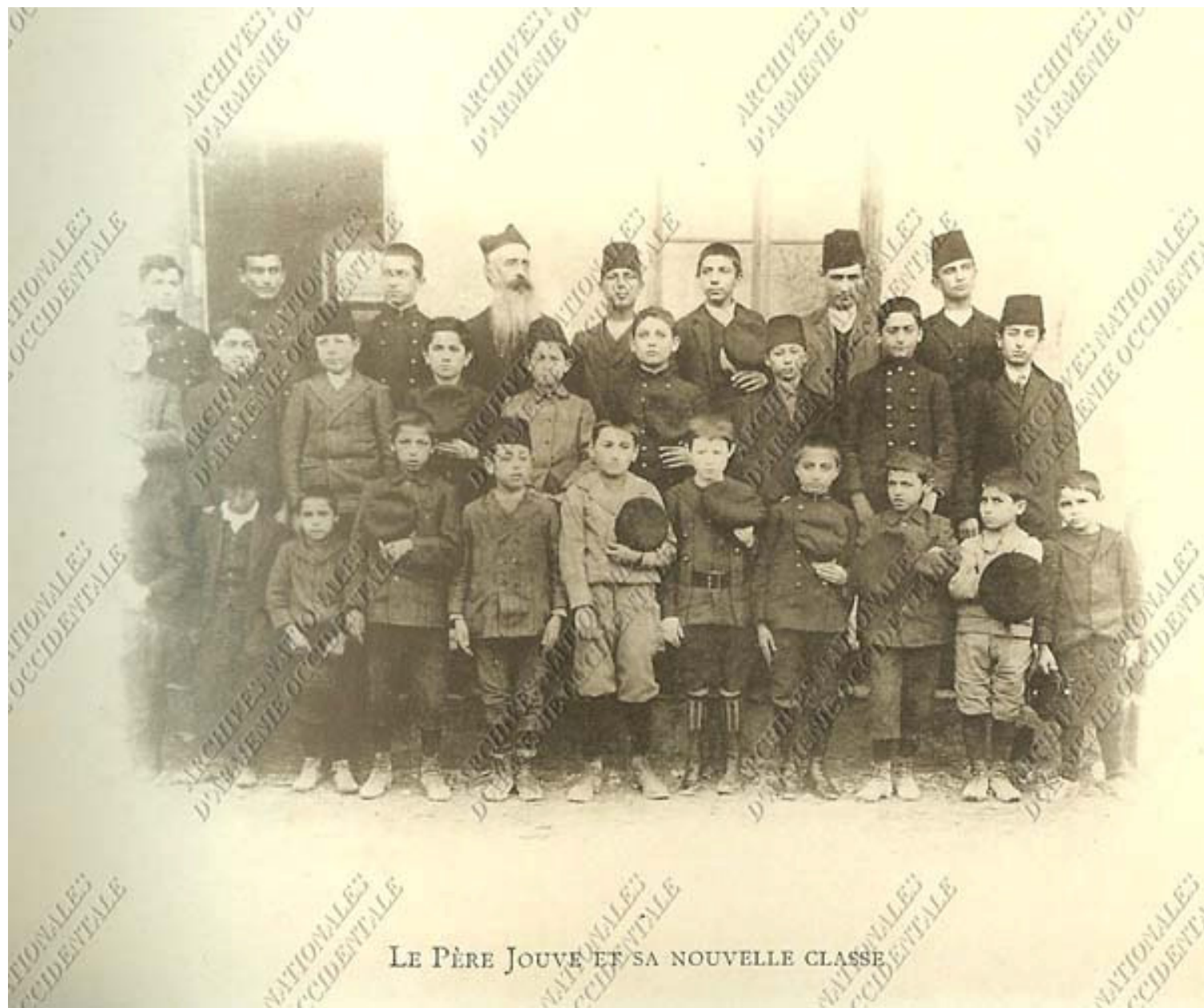
LE PÈRE JOUË ET SA NOUVELLE CLASSE