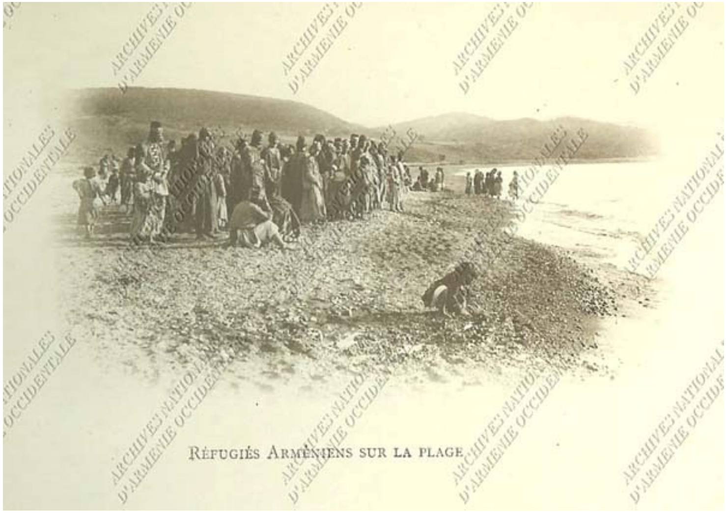
RÉFUGIÉS ARMÉNIENS SUR LA PLAGE