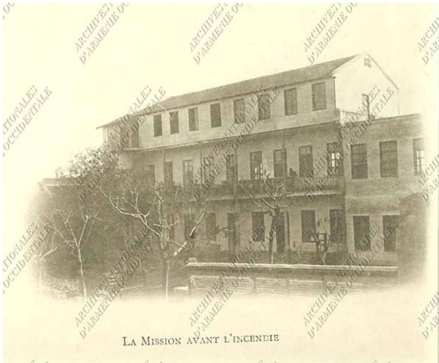
LA MISSION AVANT L'INCENDIE