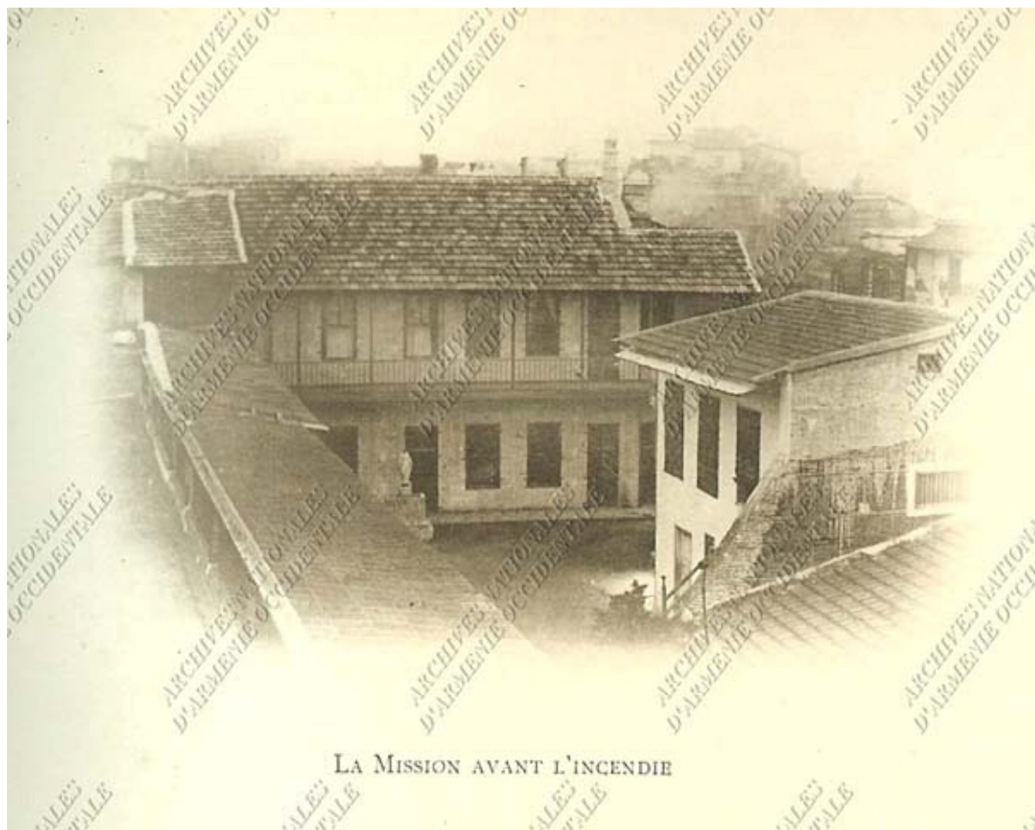
LA MISSION AVANT L'INCENDIE