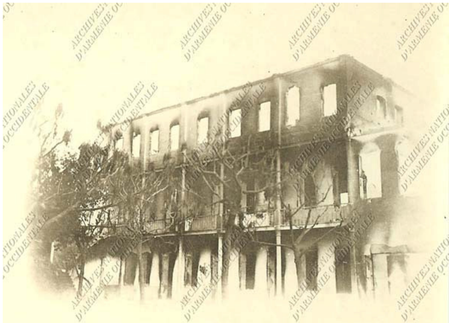
RESTES DE L'ÉTABLISSEMENT DES JÉSUITES