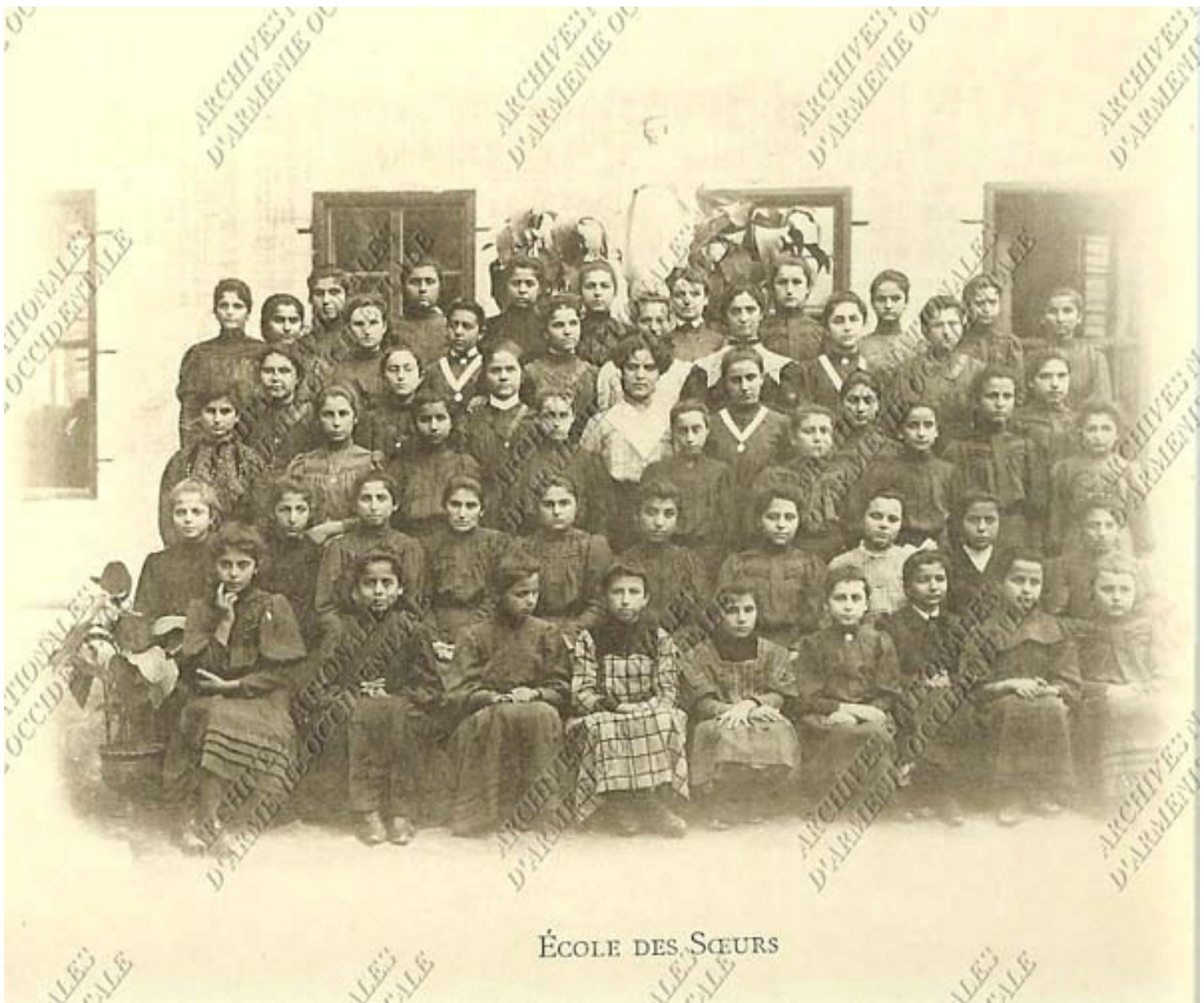
ÉCOLE DES SŒURS