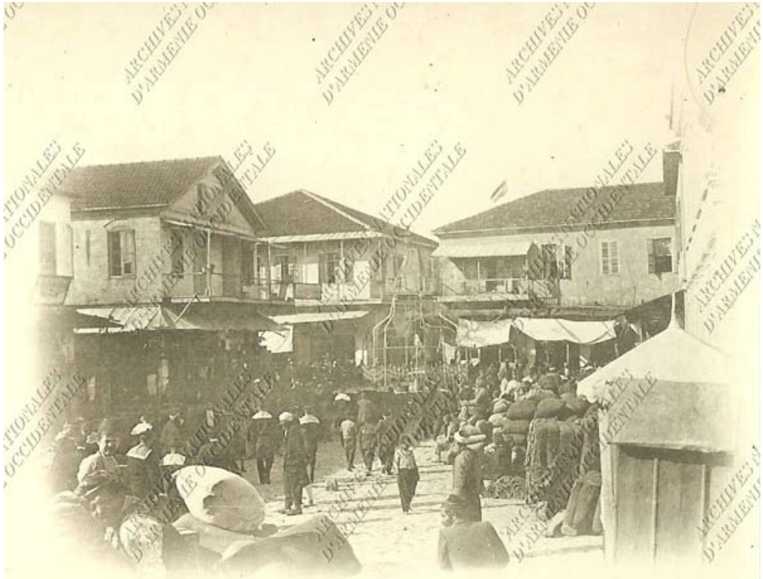
ENTRÉE DE LA VILLE