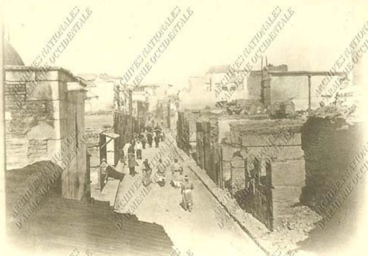
APRÈS L'ENLÈVEMENT DES DÉCOMBRES