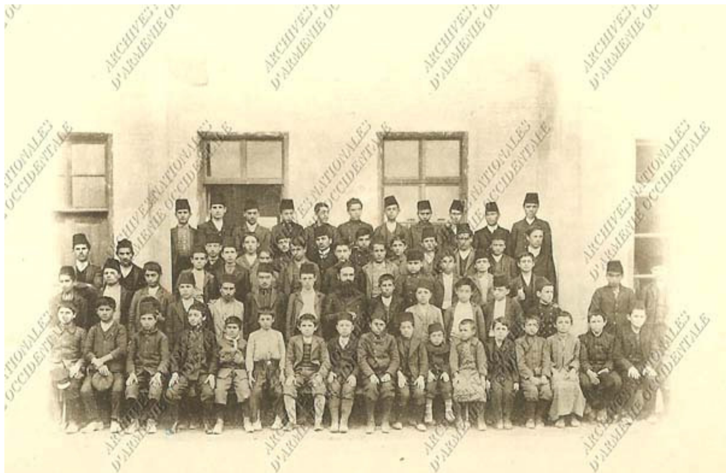
RÉOUVERTURE DE LA MISSION FRANÇAISE