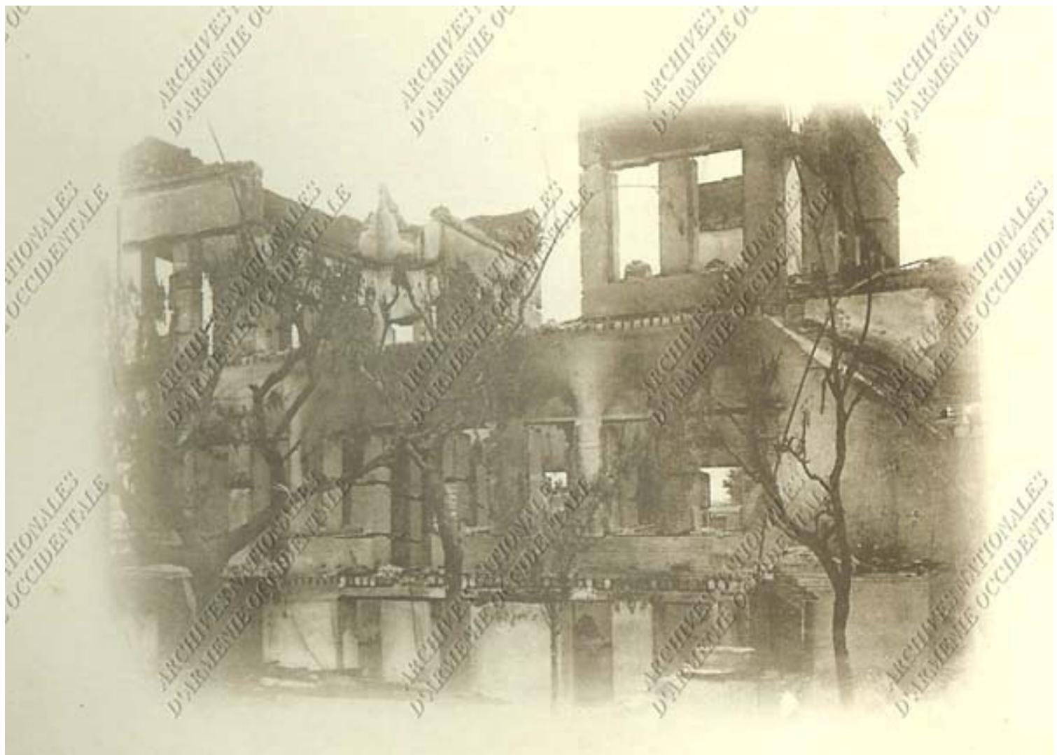
L'ÉCOLE DES SŒURS APRÈS L'INCENDIE