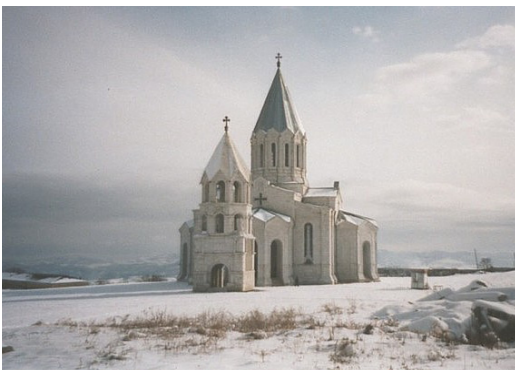
La Cathédrale Kazanchetsots